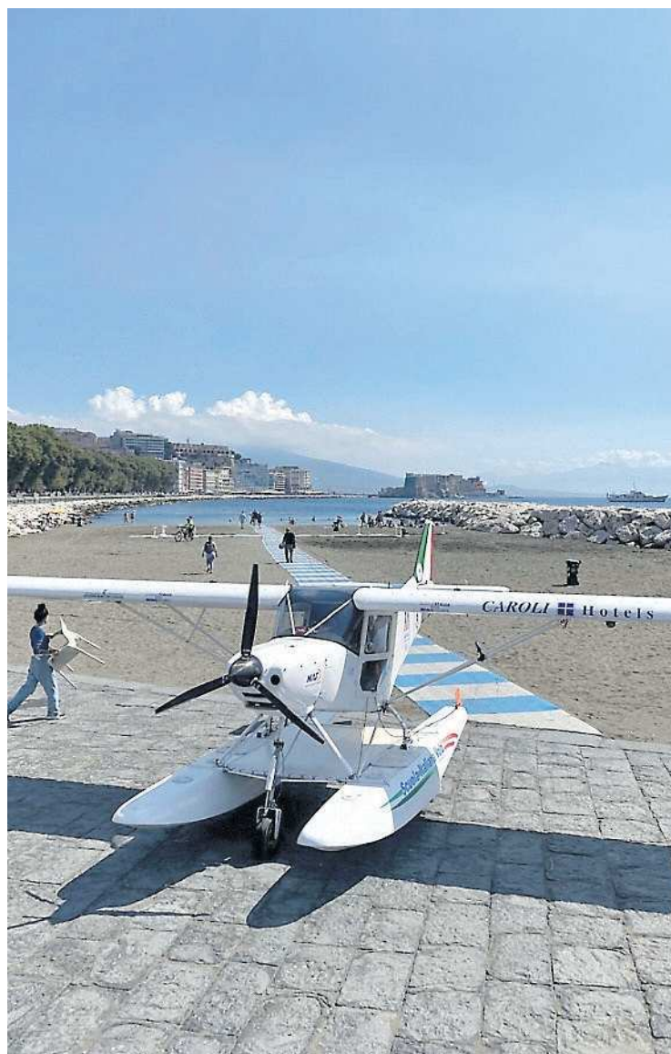
Uno degli otto ultraleggeri arrivati alla Rotonda Diaz